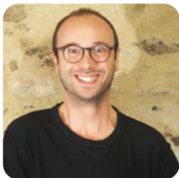
• Metteur en scène et comédien (alternant)