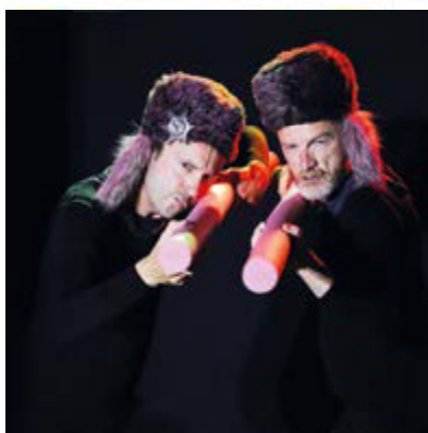
La brigade anti-loup à sa recherche.

Mardi 17 mai après la classe, l'école de la Visitation recevait les comédiens de la troupe Les machines à trucs qui interprétaient le livre de jeunesse de Wilfrid Lapanu : « Le Loup en slip ». À l'initiative de l'association des parents d'élèves des écoles privées, trois séances gratuites étaient au programme. La frousse, la peur, les chocottes qu'inspire le grand méchant loup aux dents acérées en a fait voir de toutes les couleurs car petits et grands ne sont pas rassurés au milieu de la forêt ! Une vente de produits anti-loup prospère pour neutraliser l'intrus détesté mais le loup, affublé d'un slip, est en réalité un bon gentil loup inoffensif et bienveillant... Alors, plus de vente, l'économie de la forêt s'écroule.